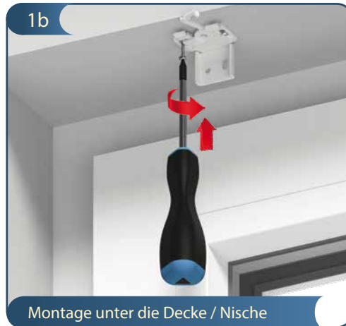
Montage unter die Decke / Nische