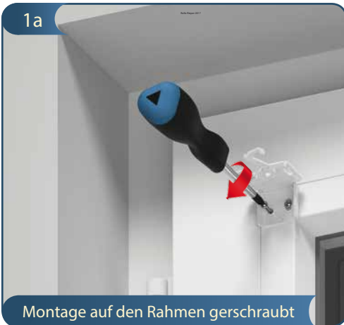
Montage auf den Rahmen gerschraubt