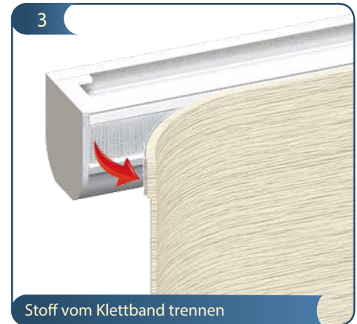
Stoff vom Klettband trennen