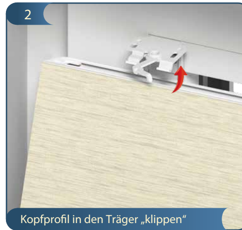
Kopfprofil in den Träger „klippen“